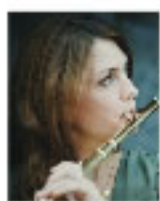
ビルギット・ラムスル・ガール (フルート)