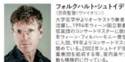
フォルクハルト・シュタイデ (芸術監督/ヴァイオリン)