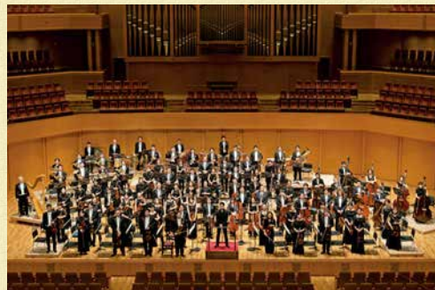
管弦楽 名古屋フィルハーモニー交響楽団